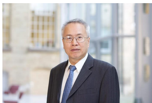
Рис.2 Чжунминь Ву, профессор Партийной школы ЦК КПК.