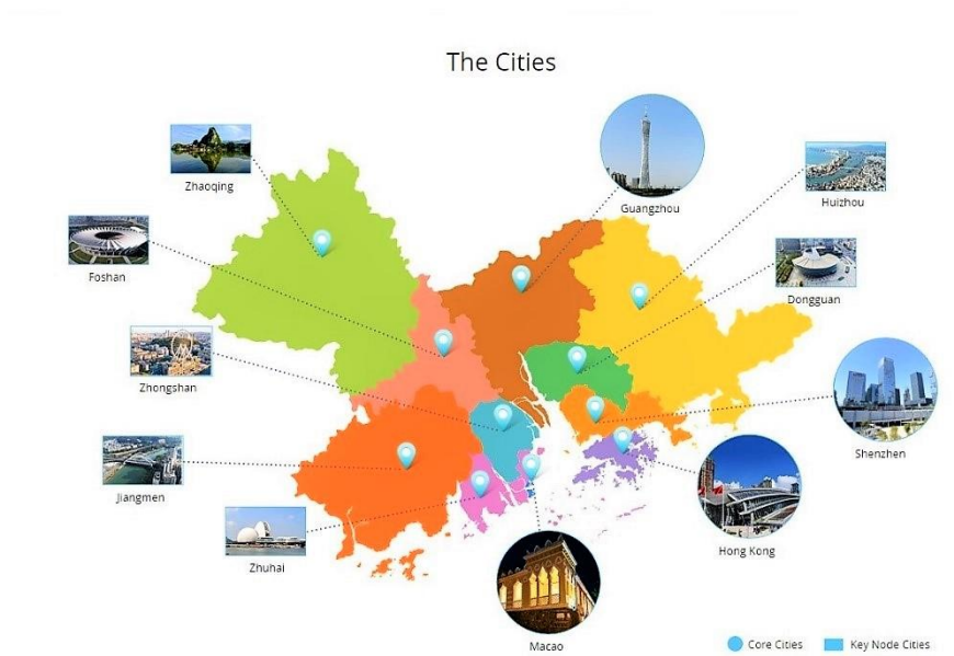
Рис.2. Города, входящие в проект «Зона интенсивного сотрудничества Гуандун-Макао.

«Городское и региональное сотрудничество и развитие. Проблемы и стратегии планирования и развития зоны интенсивного сотрудничества Гуандун-Макао на острове Хэнцинь», авторы Лонг Чжоу, Бин Ли, Сихонг Ли, Нган Ленг Лей, Кенгфонг Чеонг, издана в издательстве Springer в конце 2022 года, опубликована в 2023 году и находится в открытом доступе для всех желающих ( https://link.springer.com/book/10.1007/978-981-19-8061-9#about-this-book ).