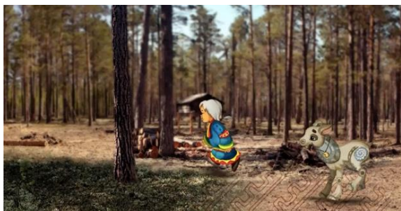
Рис. 7. Кадры из анимационного фильма «Маленькая Катерина», 2025.