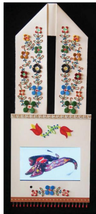
Рис. 4. Б. Эйс. Патронташ «Трансформация», 2015, смешанная техника.

Что же касается проектов уроков Б. Эйса, то они касаются очень сложной темы возвращения земель анишинабе, теме идентичности коренного народа, при том, что ученикам предлагается вдохновиться работами самого художника (Рис. 4), но при этом не присваивать уже в своих работах его коренную символику. И в этом моменте возникает очень сложная и дискуссионная тема апроприации культуры, которая, конечно же, должна обсуждаться на уроках (Garneau, Cross, 2018: 38).