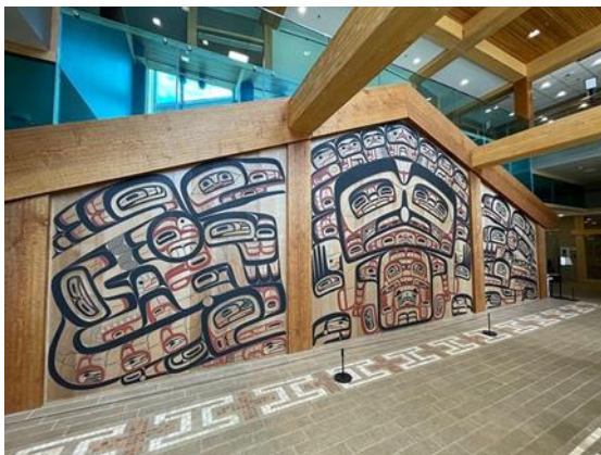
Рис. 1. Здание Института наследия Сеаласки (Sealaska Heritage Institute, SHI)