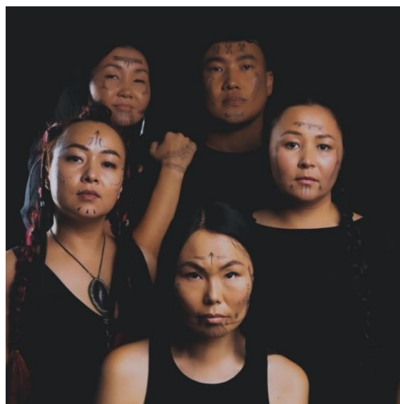
Рис. 6. Участники проекта «Шитые лица»

Реконструкция как вариант проекта из найденных примеров больше позиционируется как этнокультурный, однако напрямую имеет отношение к хоть и своеобразной, но оцениваемой вполне с художественной позиции традиции эвенков, а именно к искусству татуировки на лице. Проект называется «Шитые лица», инициирован он представителями эвенкийского этноса, проживающими на территории Бурятии. Участники отобрали этнографический материал, где в описаниях и рисунках содержалась информация о татуировках у эвенков, с помощью профессионалов, работающих в индустрии красоты, перенесли рисунки на лица, а далее последовала фотосессия с включением также и атрибутов традиционной культуры эвенков, таких как колчан с луком, бубен и т.п. (Рис. 6) (V Buryatii zapustili..., 2024).