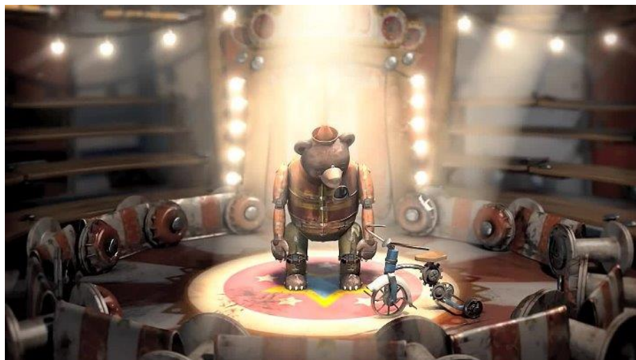
Рис. 1. Кадр из анимационного фильма «Медвежья история».

– личная травма, которую приходится проживать снова и снова, но потребность в том, чтобы поделиться этим с окружающими, сильнее боли от воспоминаний. Однажды Медведь, который счастливо жил со своей женой-медведицей и ребенком-медвежонком, попадает в список неудобных государству и его забирают... в цирк (рис.1). Здесь, конечно, режиссер прямым текстом сообщает о том, на что было похоже правительство во время диктатуры Пиночета.