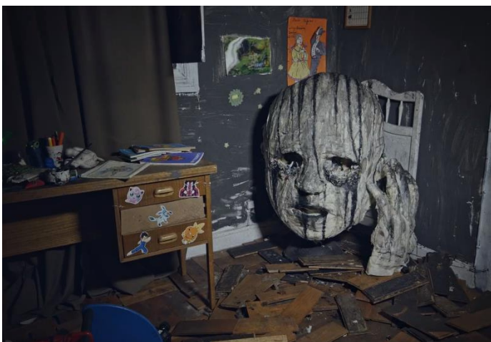
Рис. 2. Кадр из анимационного фильма «Дом волка».

На первый взгляд, в фильме форма важнее содержания. Фрагменты сюжета различимы лишь в самом начале, а затем утопают в потоке сюрреализма. В картине нет ни четкого повествования, ни внятного диалога, ни различных персонажей. История представляет собой череду слабо связанных между собой событий, представленных в виде безумных образов (рис.2), каждый из которых затягивает сюжет в совершенно непредсказуемую сторону. Однако это только на первый взгляд.