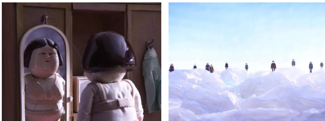
Рис. 5 и 6. Кадры из анимационного фильма «Зверь».

Фильм снят с использованием техники покадровой анимации, он создавался съемочной командой около трех лет. Режиссер работает в этой технике с 2005 года. По словам Уго Коваррубьяса он использует эту технику, потому что в ней «присутствует пластиковая составляющая, ручная и аналоговая, она позволяет создавать миры, которые было бы очень сложно создать цифровым способом». Герои анимации «Зверь» созданы при помощи различных материалов: ткань, войлок, картон и даже фарфор, из которого сделаны головы людей, в том числе и голова кукольной Ингрид Ольдерек. Фарфор здесь придает холодность, отчужденность и безэмоциональность главной героине, на фоне картонных декораций ее глянцевая фарфоровая голова визуальнo резонирует с грубым по цвету и непрозрачным пространством. «Зверь» – попытка осмысления истоков коллективной травмы, которая в большинстве своем возникла уже после ужасного времени диктатуры Пиночета, когда были обнародованы все описания пыток в отчетах полиции. «Зверь» выделяется своей темой, определенной эстетикой, и тем, как эта политическая тема переосмыслена. Нельзя не отметить музыку (композитор Angela Acaña), которая закрадывается к зрителю в душу и благодаря нервной скрипке создает саспенс похлеще чем у Хичкока.