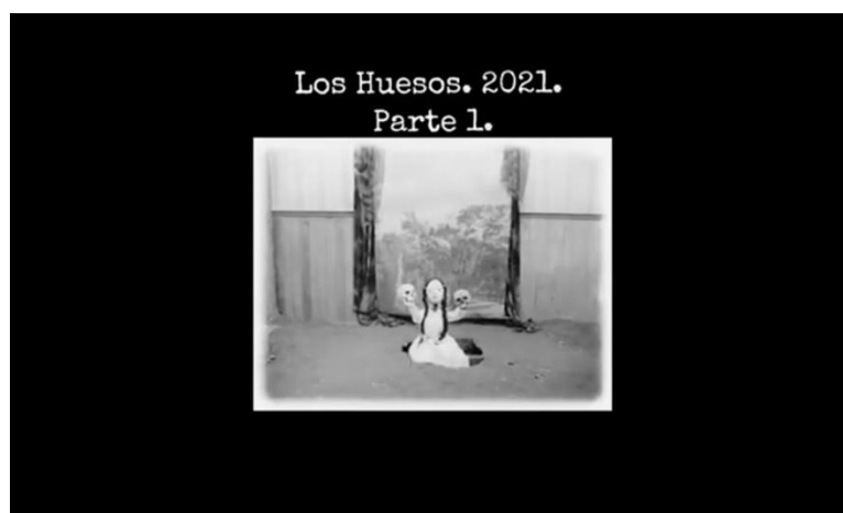
Рис. 7. Кадр из анимационного фильма «Кости».

Содержание фильма, однако, отличается от салонных мелодрам, принцип построения истории нарушается. Главная героиня – женщина, которая решает провести магический обряд и вернуть к «жизни» двух умерших людей – мужа и священника, который когда-то их обвенчал (рис. 7). Ее действия поворачивают время вспять и из земли под полом появляются останки, которые постепенно складываются в фигуры когда-то живших людей. Целостность фигур относительна, ряд костей заменяется ветками или вещами, но этого хватает, чтобы притянуть к ним души усопших. Воскрешает их, однако, не сила любви, но сила отчаяния. Женщина, несмотря на привязанность к мужу, хочет расторгнуть брачные узы, провести обряд бракосочетания «наоборот» – не ставя подпись, а убирая ее со свидетельства. Когда показывается подпись мужчины становится ясной причина происходящего. Супруг женщины – Диего Порталес Паласуэлос – политический деятель, которого многие считают одним из первых тиранов и диктаторов в Чили, чья деятельность привела к военному восстанию и повлияла на дальнейшую историю страны. Считается, что именно Диего Порталес создал культ «сильной руки», на который впоследствии ровнялся Пиночет, проводя свою политику.