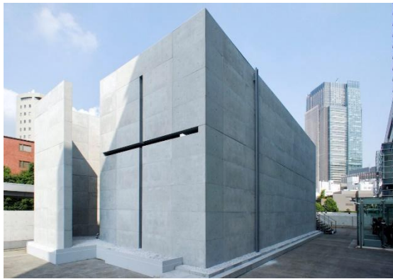
Рис. 1. «Церковь Света». Fig. 1. "Church of Light".

Самым любимым строительным материалом Андо стал бетон. Его стены толстые, массивные, тяжелые, без украшений. Скамейки для молящихся, так же, как и половицы церкви, сделаны из использованных при строительстве лесов. Вырез в форме креста, располагающийся на восточной стене храма – остеклён.