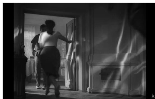
Рис. 12. Кадр из фильма «Летят журавли»: вручение повестки – «Благовещение»

В финале сцены в темную комнату распаивается дверь, из которой льется свет, входит Степан с повесткой Борису об отправке на фронт – это позволяет сопоставить данный образ с Благовещением, а Бориса со спасителем.