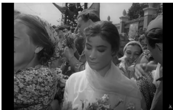
Рис. 7. Кадр из фильма «Летят журавли»: встреча победителей с фронта (белые одежды)

Образ Бориса – солдата, ушедшего на фронт и погибшего во время вылазки на разведку – сразу связан с пустотой. Когда объявляют начало войны, он уже отсутствует за столом и вместо него нам показывают пустой стул за общим столом.