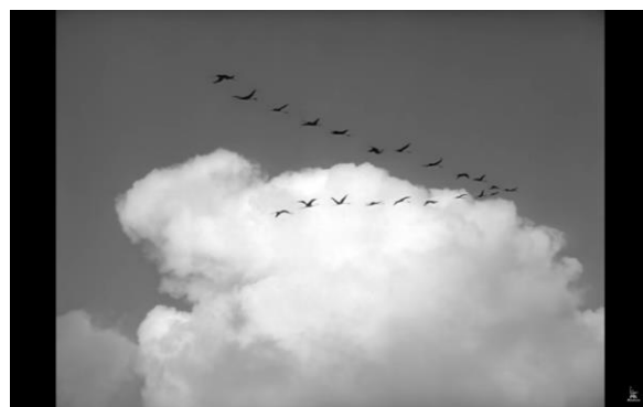
Рис. 18. Кадр из фильма «Летят журавли»: журавли улетают – беда уходит

Особенности символического статуса фильма «Летят журавли»