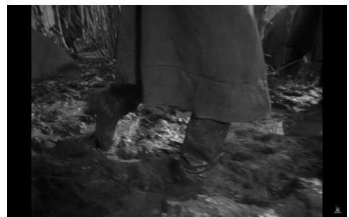
Рис. 15. Кадр из фильма «Летят журавли»: образ войны – грязь

с другим солдатом за честь Вероники. Этот же солдат наигрывает на губной гармошке ту же мелодию «Летят журавли». Короткий монтажный кадр сообщает, что в это время Марк и Вероника сообщают семье Бороздиных о своем решении пожениться. Далее следуют кадры со смертью Бориса и его мечтами о свадьбе с Вероникой: кружащие вокруг него березы сопоставляются с кружением по лестнице во время отношений с Вероникой. Сцена заканчивается тем, что Борис падает спиной в грязь, а следующий монтажный кадр начинается на вокзале, где происходит эвакуация людей из Москвы в Сибирь. Диктор по громкоговорителю объявляется, что «Сегодня на фронте не произошло ничего существенного». Это фраза подсказывает, что создатели фильма цитируют Эриха Марии Ремарка «На западном фронте без перемен», а также заимствуют образ войны как грязи из его произведения.