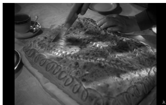
Рис. 9. Кадр из фильма «Летят журавли»: Борис – «отрезанный ломоть»

Марк создает образ предателя. В сцене воображаемой свадьбы с Вероникой именно он целует Бориса в щеку как Иуда.