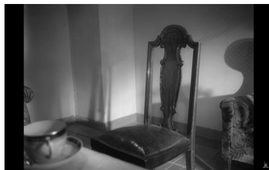
Рис. 8. Кадр из фильма «Летят журавли»: пустой стол Бориса

До пустого стула в кадре зрителям показывают, как отрезают кусок пирога, что также сопоставимо с образом Бориса. Он является символом пустоты, которая возникла на месте не вернувшихся с фронта мужчин. Также его образ сопоставим с образом спасителя.