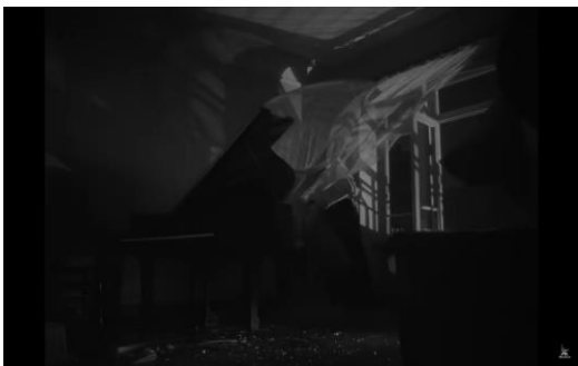
Рис. 14. Кадр из фильма «Летят журавли»: «мрачная свадьба» Марка и Вероники

Сцена измены Марка и Вероники визуально подобна сцене с несостоявшейся свадьбой Бориса и Вероники: она также решена практически в темноте, а поцелуй персонажей происходит за тюлем. Во время бомбежки Марк играет на рояле мелодию песни «Летят журавли», которую композитор Моисей Вайнберг написал специально для фильма. Вероника сопротивляется, но в итоге Марк уносит ее разбитую на руках (Веронику с закрытыми глазами Марк несет по битому стеклу, кадры лица и стекла накладываются друг на друга визуально).