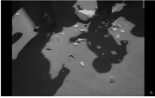
Рис. 13. Кадр из фильма «Летят журавли»: солдаты на войне как растоптанные крошки

Сцена измены Марка и Вероники визуально подобна сцене с несостоявшейся свадьбой Бориса и Вероники: она также решена практически в темноте, а поцелуй персонажей происходит за тюлем. Во время бомбежки Марк играет на рояле мелодию песни «Летят журавли», которую композитор Моисей Вайнберг написал специально для фильма. Вероника сопротивляется, но в итоге Марк уносит ее разбитую на руках (Веронику с закрытыми глазами Марк несет по битому стеклу, кадры лица и стекла накладываются друг на друга визуально).